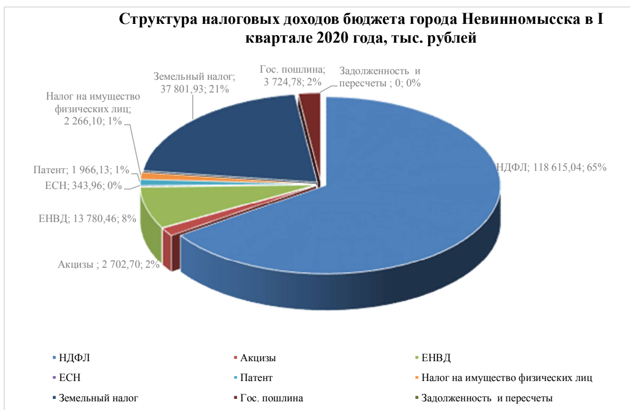
Диаграмма № 2

Поступление неналоговых доходов за I квартал 2020 года составило 47 997,90 тыс. рублей, что составляет 27,42 процента от утвержденных плановых назначений на 2020 год, за I квартал 2019 года поступило 39 008,27 тыс. рублей или 20,91 процента. По сравнению с аналогичным периодом 2019 года поступление неналоговых доходов увеличилось на 8 989,63 тыс. рублей или на 23,05 процента.