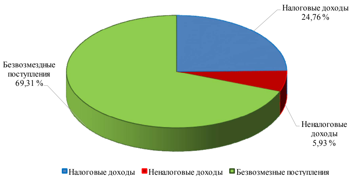
Структура исполнения доходной части бюджета города в I полугодии 2020 года